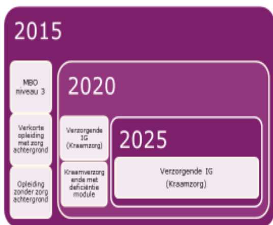
Fasering ontwikkeling deskundigheidsniveau kraamverzorgende

Met het Visiedocument "Kraamzorg verzekerd van een goede toekomst" (Deen, 2015) over de rol en positionering van de kraamverzorgende in de geboortezorgketen heeft het Kenniscentrum Kraamzorg een duidelijk statement afgegeven voor wat betreft de ontwikkeling van het deskundigheidsniveau van de kraamverzorgenden in de komende jaren.